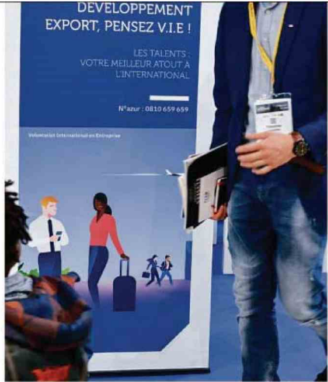
*LES ÉCHOS* / SOURCE : BUSINESS FRANCE - PHOTO : STÉPHANE AUDRAS/RÉA